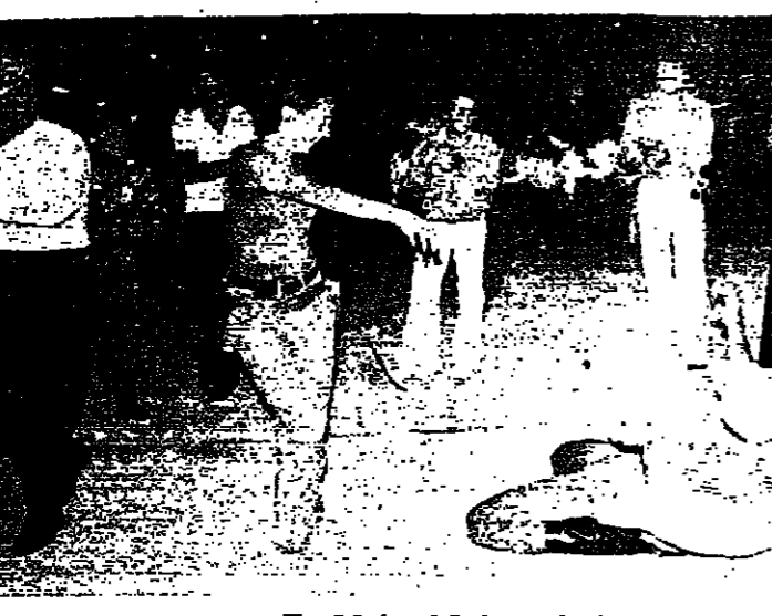
ساحة اجنبية تشترك بوصول رقص شرقية